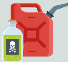
График работы, условия приема и другую актуальную информацию см. на сайте www.hanau.de — поиск по ключевому слову «отходы»

лаков, красок, растворителей, химикатов, медицинских средств, чистящих средств, кислот, косметических средств, средств для защиты растений и борьбы с вредителями, растительных и животных жиров и масел